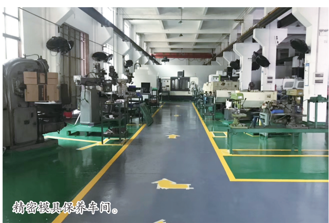
精密模具保养车间。

佛山以卓智能装备制造有限公司(以下简称“以卓智能”)成立于2011年8月,坐落于珠三角腹地——享有全国家电、机械装备制造业重地之称的顺德,毗邻广州南站,交通便捷,是一家集研发、生产、销售及服务于一体,致力于为广大客户提供技术领先、品质卓越的产品制造服务型企业。自成立以来,以卓智能始终坚持以科技研发和市场销售作为工作的核心,优化和整合企业资源,使企业走向高新科技、高起点道路,并擅长于高精密非标准件产品的设计和开发,以满足不同客户的需求,在主营业务各个领域均取得了显著的成就。主要客户包括:格力、美的、海信、海尔、奥克斯、长虹、TCL、格兰仕、申菱、天加、江森自控、麦克维尔、松下、三菱、日立、东芝、LG、开利等空调行业的头部企业。